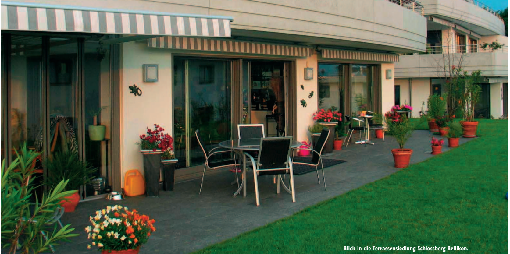
Blick in die Terrassensiedlung Schlossberg Bellikon.