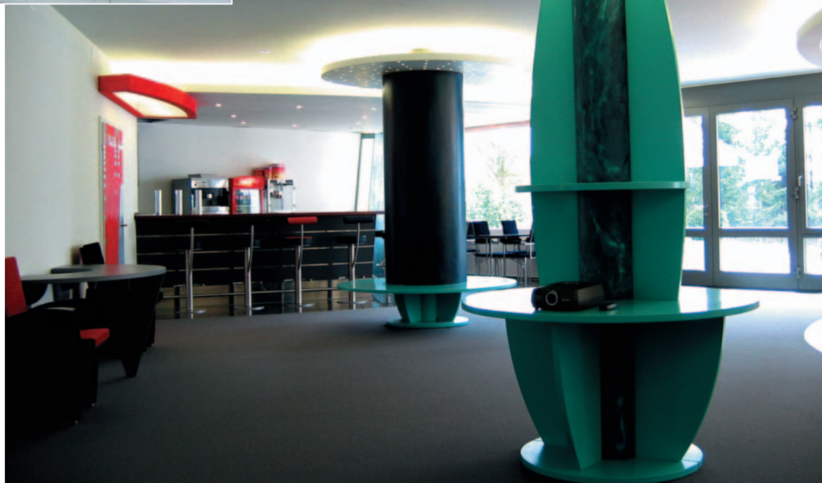
... als ineinander verwobene Ausstellungs-, Demonstrations-, Arbeits-, Bistro- und Wohnlandschaft.

Das Resultat: Alle Wohnungskäufer profitierten mindestens vom attraktiven Grundangebot einer Multiroom-Anlage mit entsprechender Leerverrohrung; vier entschieden sich zusätzlich für ein Bussystem und drei weitere für eine bus-fähige Leerverrohrung mit vorläufig konventioneller Verdrahtung. Die Mehrkosten hierfür betragen ca. 0,5% der Bausumme und sind in die Zukunft des Hauses investiertes Kapital. Drei Käufer wollten schliesslich von Anfang an voll auf Intelligentes Wohnen setzen und investierten bis zu 10% der Bausumme! Wichtigste Erkenntnis von Luginbühl: «Ich