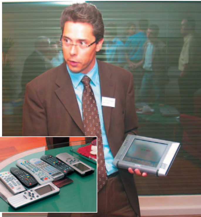
All diese Original-Fernbedienungen werden durch einen Touch-Screen von AMX ersetzt!