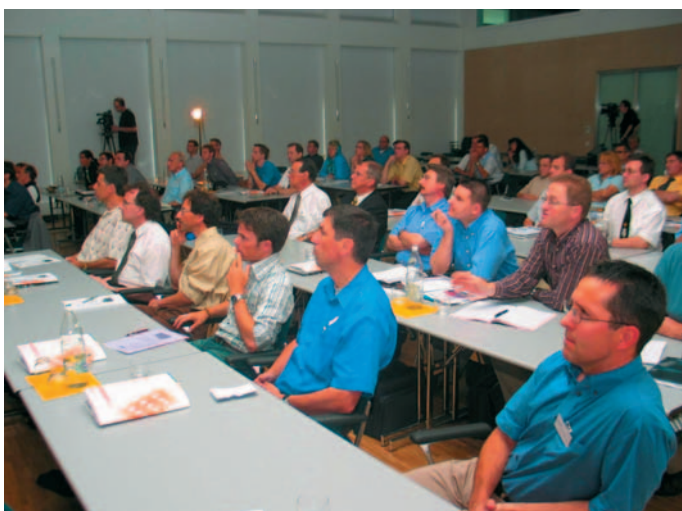
Das GNI-Schlossbergseminar stiess bei den über 70 Teilnehmern auf reges Interesse.

nung mit Luginbühl zusammen, um die Bedürfnisse abzuklären und in Form einer Grobofferte zahlenmässig auf Papier zu bringen. Nach dem Entscheid für eine Variante begann die Detailplanung, die von Aktiv Audio & Cinema AG in enger Zusammenarbeit mit dem Elektroplaner Josef Wicki durchgeführt wurde. In der folgenden Bauphase koordinierten Luginbühl und seine Crew mit dem Elektroinstallateur das korrekte Verlegen der Leerrohre und Kabel. Nach dem Einzug wurden schlussendlich die Komponenten geliefert, auf-